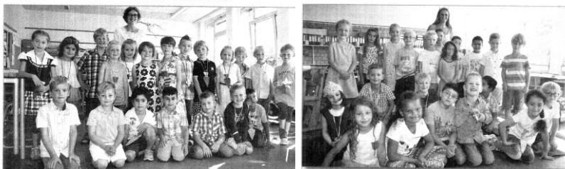
Augustinus-Schule Dülmen - Klasse 1c