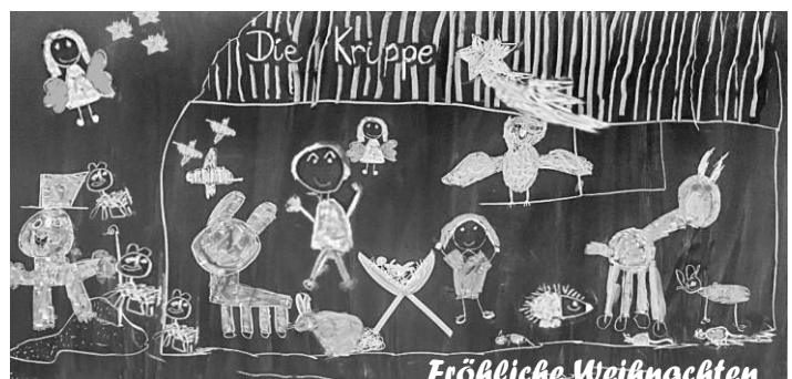
Weihnatskrippe an der Tafel der Klasse 2c

Allen schöne, erholsame Weihnachtsferien. Die Schule beginnt wieder am Montag, dem 08.01.2018, um 07.55 Uhr.