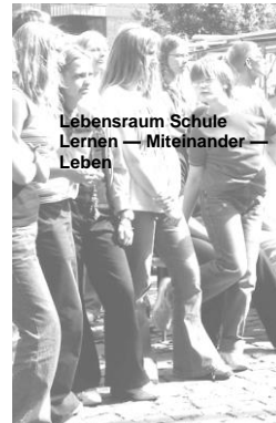
Lebensraum Schule Lernen – Miteinander – Leben

der Caritas-Fachstelle Prävention in Zusammenarbeit mit dem Schulamt für den Kreis Coesfeld u. A. sportlich nehmen und fair akzeptieren. 32 Schulen hatten sich mit 46 Projekten am Wettbewerb beteiligt, bei dem es um die Themen soziales Lernen, Gesundheitsförderung und Persönlichkeitsstärkung ging. Die Augustinus-Schule hatte sich mit vier Wettbewerbsbeiträgen beteiligt: „Manege frei für Akrobaten, Tiere, Clownerei“, „Rundum gesund – Netzwerk Gesundheitserziehung, Unfallverhütung und Beratung“, „Dem Frieden ein Zuhause bieten-Friedenserziehung an der Augustinus-Schule“ und „Hospiz macht Schule: Leben und Sterben als miteinander verbunden erfahren“. Für uns hat es wie gesagt nicht zu einem Preis gereicht, aber dennoch war Dülmen gut vertreten. Die Ludgerus-Grundschule in Buldern (2. Platz) und die Marien-Grundschule in Rorup (1. Platz) sind die erfolgreichen Vertreterinnen der Dülmener Grundschulen. Herzliche Glückwünsche den beiden Schulen. Wer sich über unsere Beiträge genauer informieren möchte, kann das einfach über die Schulhomepage tun ( www.asd.duelmen.org // Menü: Lernen – Auswahl: Rundum gesund / Menü: Leben – Auswahl Friedensfähigkeit)